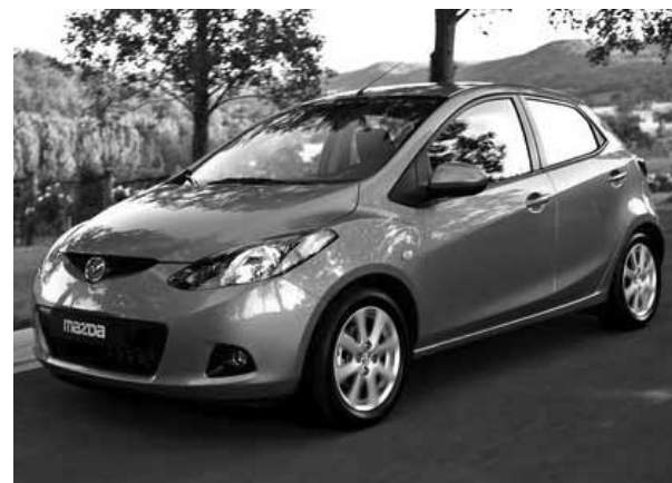
INFO : MAZDA VARESE - Viale Valganna, 130 21100 Varese - tel. 0332 296211

role, questa è la vettura che amerai guidare. E far vedere. Nuova Mazda2 offre efficienti e moderni motori a benzina da 1.300 cc (75 CV e 86 CV) e da 1.500 cc. (103 CV), con comando sequenziale delle valvole. E grazie al sistema di aspirazione a geometria variabile (VIS) ottimizza l'erogazione della coppia in ogni situazione di guida, contenendo al massimo i consumi. Il nuovo pianale garantisce un'eccezionale tenuta di strada, una straordinaria stabilità anche in autostrada e un'efficace regolazione delle sospensioni. Gli spostamenti nel traffico urbano sono un gioco da ragazzi, grazie a un diametro di sterzata ridotto di 9,8 metri. Il servosterzo elettrico aiuta a reagire prontamente agli imprevisti. Le dotazioni di sicurezza attiva comprendono: sistema antibloccaggio delle ruote in frenata (ABS) con sistema di ripartizione elettronica della forza frenante (EBD) e assistenza alla frenata di emergenza (EBA), controllo dinamico della stabilità (DSC) e sistema di controllo della trazione (TCS) quest'ultimo, di serie sul 1.500 103 CV Fun, optional su tutte le versioni. Prezzi a partire da 11.200 €chiavi in mano.