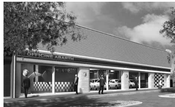
Venerdì 12 ottobre, ore 19, non si può mancare alla presentazione della nuova Concessionaria Abarth Masera & Bacelliere a Tradate - Via Europa 10 - statale Varesina.

Se vi piace la Grande Punto Abarth, ma non ritenete "sufficienti" i 155 CV è già previsto un kit di potenziamento SS (significa Super Sport): può essere installato solo nelle concessionarie Abarth. Al termine dell'intervento, è lo stesso preparatore a curare la pratica di omologazione della vettura: po-